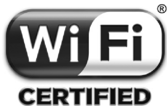
Рис. 1.1. Логотип Wi-Fi Alliance

При полном соответствии оборудования всем предъявляемым Wi-Fi Alliance требованиям производитель может разместить на упаковке информацию о его сертификации (рис. 1.1). Компания D-Link является постоянным членом консорциума Wi-Fi Alliance.